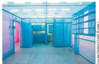
他二〇一五年把紐約的居住地點用透明布料還原。(Jerry Richfield圖)