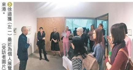
徐道獲(左二)最近為個人展覽來港。

英文名字：Do-Ho Suh 出生年份：1962 出生地點：韓國首爾 學歷：首爾大學、羅德島設計學院及耶魯大學